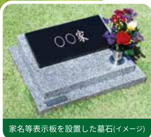
家名等表示板を設置した墓石(イメージ)