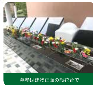
墓参は建物正面の献花台で